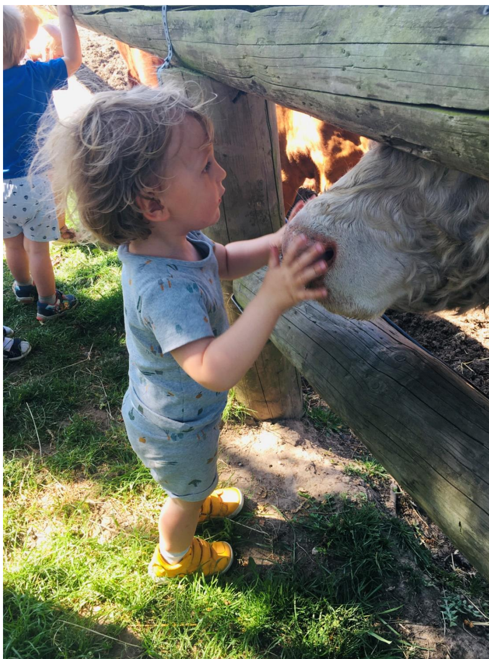
Vuggestue på bondegårdsbesøg